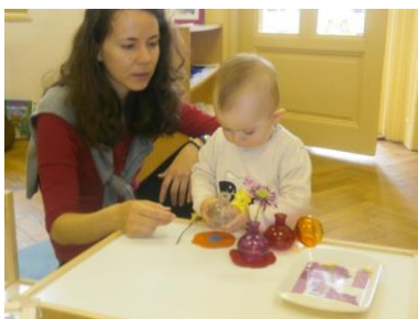
roční dítě nacvičuje praktický život

Oslovujeme další subjekty s nabídkou návštěvy našeho RC a možností vzdělávání pedagogů na našich seminářích.