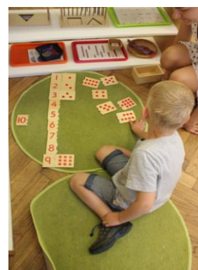
předškolní dítě se učí počítat do 1.000